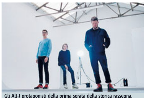
Gli Alt-J protagonisti della prima serata della storica rassegna.

MUSICA Sarà un concerto degli Alt-J a inaugurare domenica h21,30 l'edizione 2015 di Postepay Rock in Roma. La rassegna, in programma fino al 6 settembre nel tradizionale spazio dell'Ippodromo delle Capannelle, ospiterà i concerti di alcune fra le più grandi stelle della scena pop e rock italiana e in-